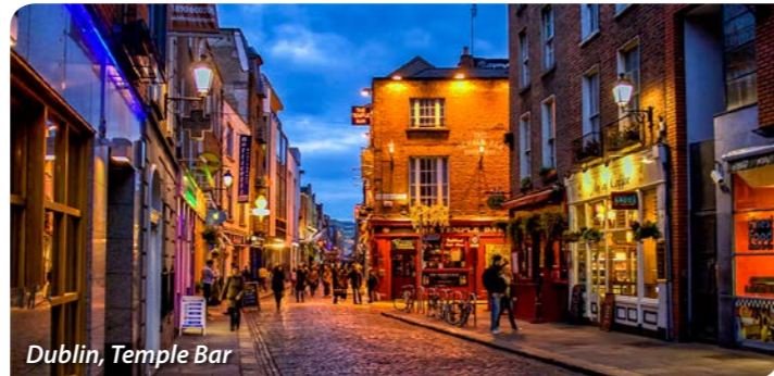
Dublin, Temple Bar

ČTYŘDENNÍ POZNÁVACÍ ZÁJEZD DO IRSKA, V RÁMCI KTERÉHO POZNÁTE NEJEN HLAVNÍ MĚSTO DUBLIN, ALE TAKÉ PŘEKRÁSNÉ HISTORICKÉ PAMÁTKY A ÚCHVATNOU KRAJINU.